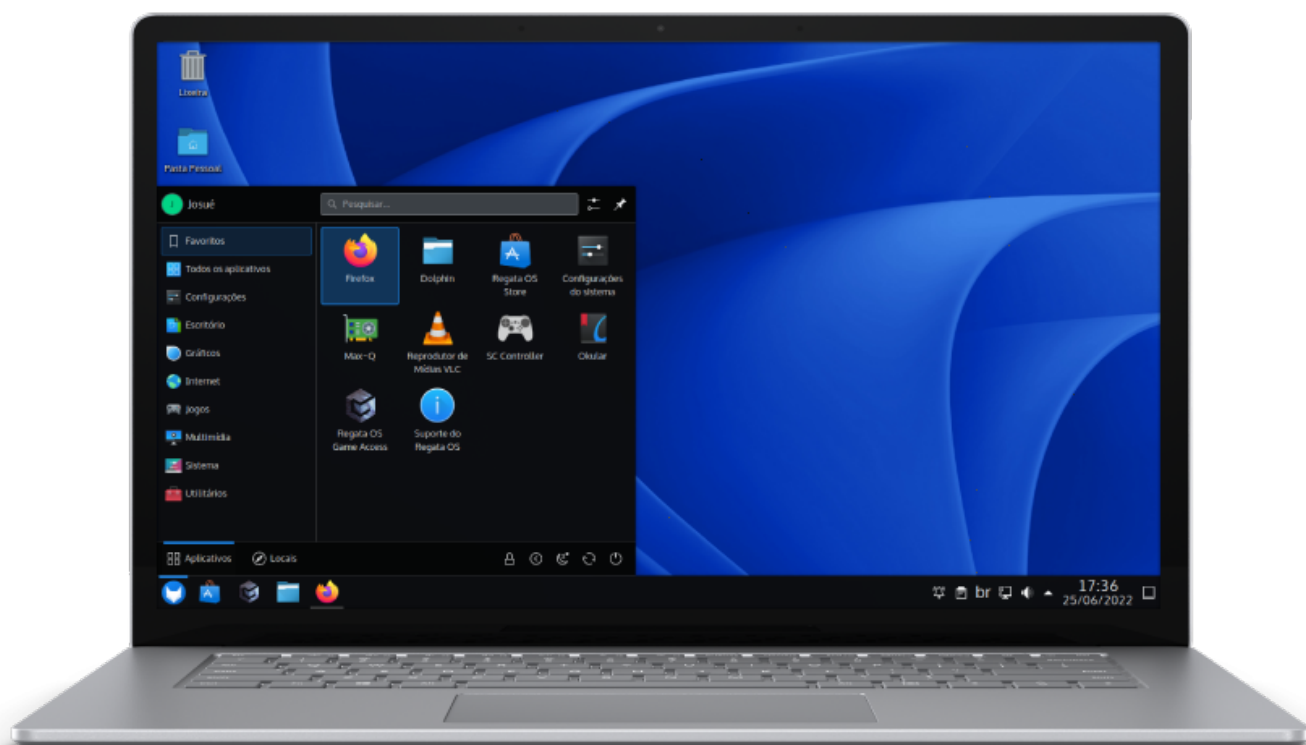
Imagem do KDE Plasma no RegataOS.